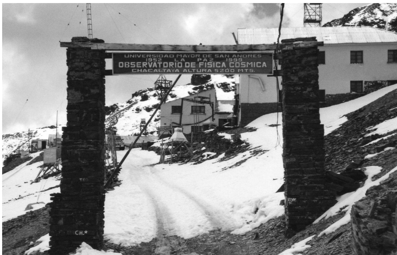
Fig. 3. – L'ingresso al Laboratorio.

causa dei campi magnetici nella nostra Galassia e quindi non ci portano informazioni dirette dalla sorgente.